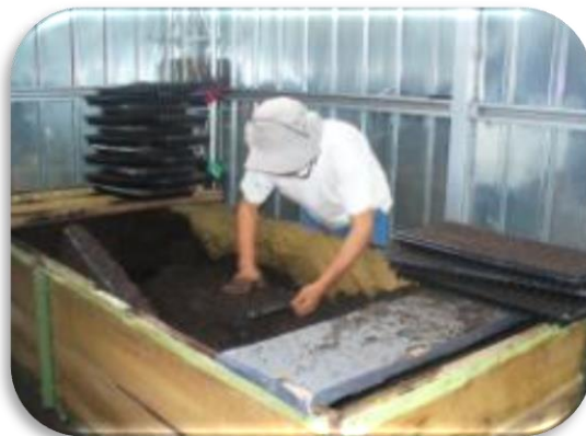
Figura 1. Operario llenando semilleros o bandejas con turba